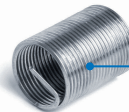
2,5 × d