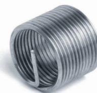
1,5 × d