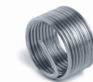
1 × d

резьбовой вставки пружинка слегка растягивается, что обеспечивает уплотнение резьбы. Поэтому резьбовая вставка при ввинчивании удлиняется. Мы поставляем три частоиспользуемых размера (1 × d, 1,5 × d и 2,5 × d).